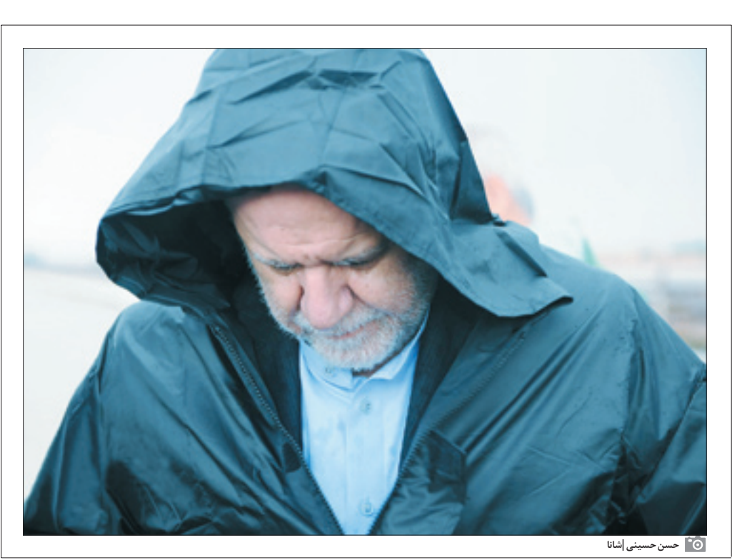
حسن حسینی ایشا

ضعف عملکردی وزیر نفت و افزایش انتقاده‌ها نسبت به کم‌کاری وزارت نفت برای تثبیت صادرات نفت، استیضاح وی را در مجلس کلید زد. چندی پیش بود که عزت‌الله ضرغامی در توییتی نوشت وزیر نفت از اقدامات قضایی واهمه دارد و به همین دلیل برای دور زدن تحریم‌ها انگیزه‌های ندارد. او در توییت خود از عدم آرایش جنگی وزارت نفت نوشت تا با حمله و هجمه طرف‌داران دولت مواجه شود. پس از این توییت بود که برای نخستین‌بار، وزیر نفت به‌جای روابط عمومی خود دست به قلم برد و به ضرغامی نوشت که وزارت نفت یک سال است که آرایش جنگی به خود گرفته است.