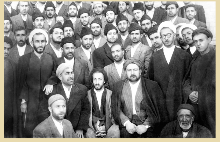
۱۳۳۱، شهید سید مجتبی نواب صفوی واقعهای فدائیان اسلام در مسیر به شهید

در دوره نخست‌وزیری دکتر مصدق اصرار فدائیان اسلام، به‌خصوص شخص نواب در ایجاد حکومت اسلامی و اجرای قوانین شریعت اسلامی به تقابل آنها با دولت و حتی آیت‌الله کاشانی انجامید و نهایت به بازداشت نواب منجر شد. این تقابل هنگامی که فدائیان اسلام تصور می‌کردند جبهه ملی برای براندازی جمعیت و عدم‌اجرای احکام اسلامی با دربار همدست شده است به اوج خود