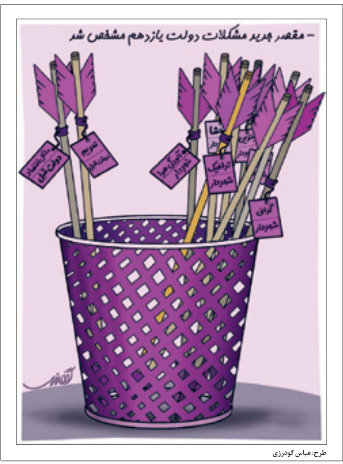
طرح: عباس گوردزی

قیمت دلار لحظه‌ای عوض می‌شدد... امروز دیگر کسی از گرانی و تورم حرفی نمی‌زند... چون کاری شد کارستان. رئیس‌جمهور خودش وقت گذاشت. روق شروع شده، و همه اهدافمان در برجام رسیدیم. ما بی‌هدف اوضاع اقتصادی مردم نمی‌کنند. حال در شرایطی که مردم خواستار توقف روند روزافزون گرانی، بیکاری و تورم هستند، اسحاق جهانگیری معاون اول رئیس‌جمهور با استفاده از تعریض و کنایه می‌گوید: «کشور از مجموعه مدیریتی توانایی برخورد است اما برخی افراد قیاس به نفس می‌کنند و این موضوع را حرفی گراف می‌پندارند و تصور می‌کنند که چون خودشان توانایی مدیریتی ندارند، مدیران کشور نیز توانمند نیستند!»