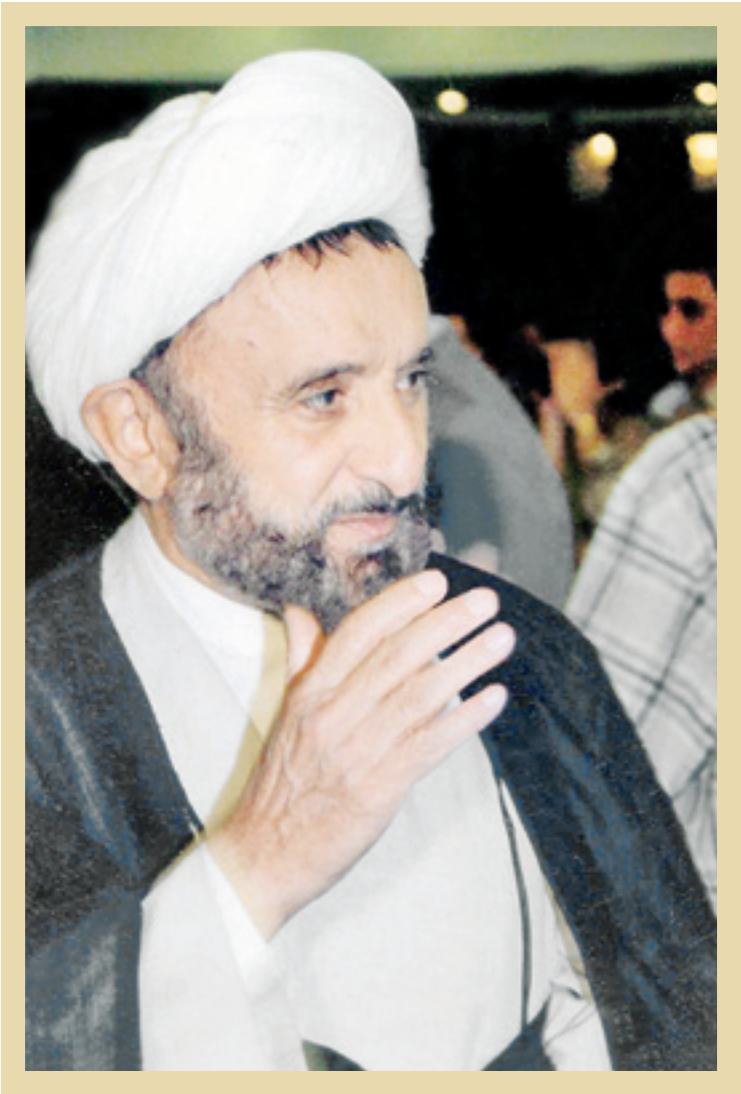
مجتبی‌الاسلام والمسلمین استاد علی دوانی، نخستین مورخ نهضت اسلامی

علامه مفضال زنده‌یاد حجت‌الاسلام والمسلمین علی دوانی، از آغازین گام‌های نهضت اسلامی، به اندیشه ضبط و نشر اسناد و نیز وقایع این حرکت افتاد. حاصل این حرکت هوشمندانه، اثر تاریخی و گرانسنگ «نهضت دو ماهه روحانیون ایران» گشت. مؤلف ارجمند در دیباچه این کتاب، بخشی از دغدغه‌های آن دوره خویش را به این شرح با مخاطب در میان نهاده است: «نویسنده این کتاب از دیر زمان متوجه این معنی بوده است که یکی از علل جدایی نسل کنونی مسلمین و بالخاص جامعه ایران از علمای دینی و روحانیون خود اطلاع نداشتن از ارزش وجودی آنها در اجتماع و موقعیت واقعی این سلسله می‌باشد. چه مردان بزرگ و علمای عالی مقداری داشته‌ایم که زحمت‌ها کشیده و به مردم و اجتماع خدمت‌نامه‌موه‌اند و در شرایط سخت دامن همت به کمر زده و کشتی طوفان‌زده مسلمین را از غرق‌بای‌های وحشتناک نابودی به ساحل نجات رهبری نموده‌اند، ولی چون این حقایق به‌قلم نیامده و به زبان روز نگارش نیافته است، جز عده معدودی