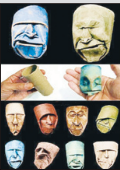
مجدد میزبانی‌نوشت: این روز، مقابلی آخر دستمال کافتنی که میندازیم دور رود پیدا میشه.پاهای این جوری هنرمندی کرد. همین.