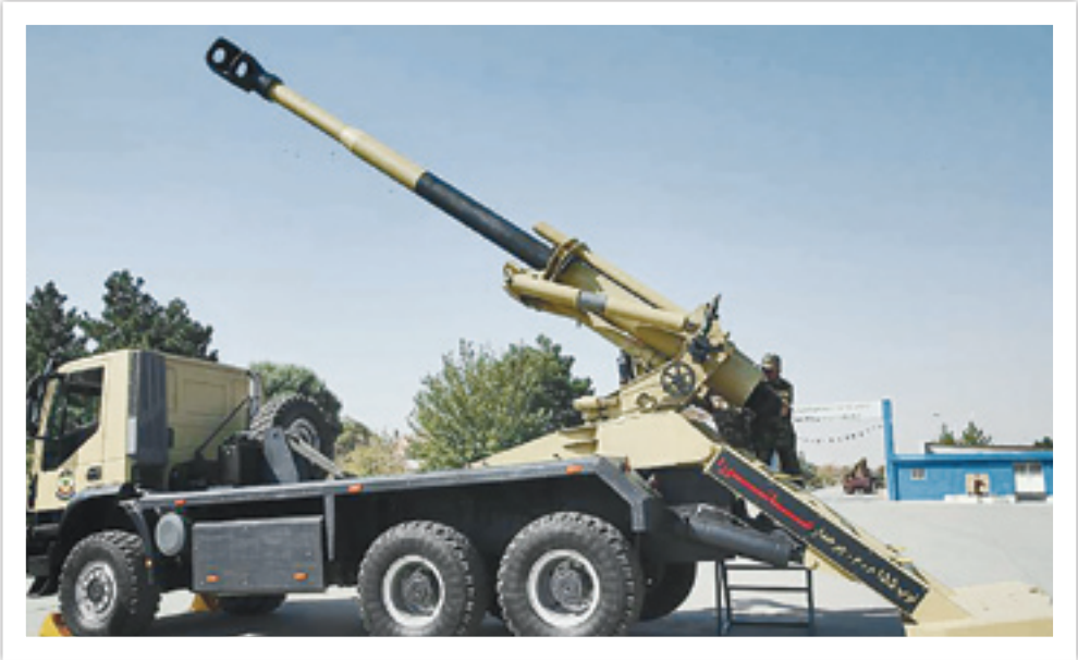
توپ ۱۵۵ میلیمتری عاقلورا

فروردین سال ۱۳۶۱، سپاه پاسداران آن میزبان از توپ‌های دشمن را طسی عملیات ثامن‌الامنه (ع)، طریق‌القدس و فتح‌المبین به غنیمت گرفته بود که بخواهد یگان توپخانه خود را تأسیس کند. در این زمان حدود ۱۰ گردان از توپ‌های غنیمتی در اختیار سپاه قرار داشت که باید سروسامانی به آنها داده