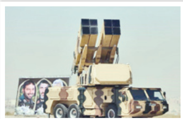
سامانه پدافند باور ۳۳۳

در زمان جنگ تحمیلی، پدافند هوایی علاوه بر اینکه وظیفه تأمین امنیت هوایی صحنه نبرد و خطوط مقدم جبهه‌ها را بر عهده داشت وظایف دیگری از جمله تأمین دفاع هوایی از شهرها در مقابله هواپیماها و حتی موشک‌های رژیم بعث