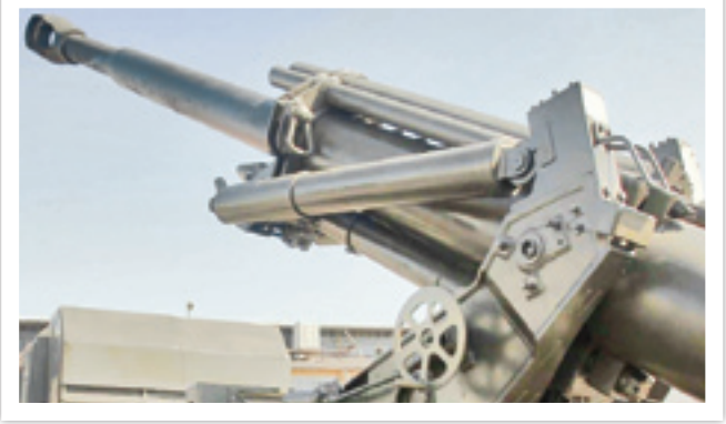
نمونه‌ای از توپ‌های ساخته شده در وزارت دفاع

این مسئله را نباید فراموش کرد که به‌رغم تشکیل یگان توپخانه سپاه، به جهت تسلیحات و تجاری که ارتش در این زمینه داشت، توپخانه ارتش تا پایان دفاع مقدس همکاری تنگاتنگی با یگان‌های توپخانه سپاه و همین‌طور نیروی زمینی آن داشت. حتی پس از اتمام سال ۱۳۶۳ که قرار شد سپاه و ارتش جداگانه عملیات انجام دهند، یگان توپخانه ارتش همچنان در عملیاتی که سپاه طراحی، فرماندهی و اجرا می‌کرد، حضور مؤثری داشت. عملیات والفجر ۸ به عنوان اولین عملیات سپاه در این دوره از جنگ، از حمایت یگان توپخانه ارتش در کنار دیگر یگان‌های آن نظیر نیروی هوایی، پدافند هوایی و... بهره می‌برد. حتی بسیاری از توپ‌های ارتش پس از فتح‌فلو تا مدت‌ها در این شبه‌جزیره