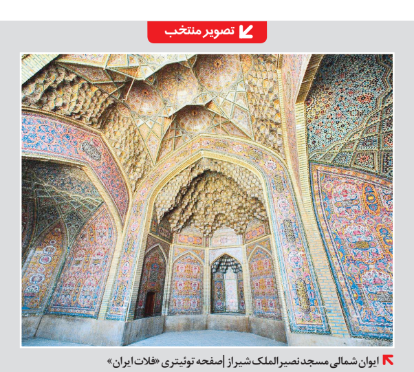
ایوان شمالی مسجد نصیرالملک شیراز

محمد شیرازی در رشته توثیتی نوشت: رسم بازاریان قدیم بر این بود که اول صبح وقتی دکان را باز می‌کردند، کرسی کوچکی را بیرون مغازه می‌گذاشتند اولین مشتری که می‌آمد جنس به او می‌فروختند بلافاصله کرسی را داخل مغازه می‌آوردند (یعنی دشت کردم) مشتری دوم که می‌آمد و جنسی می‌خواست حتی اگر خودش آن جنس را داشتند نگاه به بیرون می‌کردند که ببینند کدام مغازه هنوز کرسی‌اش بیرون است و دشت نکرده است. آن وقت اشاره می‌کردند که برو آن دکان جنس را دارد و از او بخر که او هم دشت اول را کرده باشد و بدین شکل هوای همدیگر را داشتند. امید است که تلنگری باشد برای همه ما که هوای همدیگر را بیشتر داشته باشیم. #ناسایت