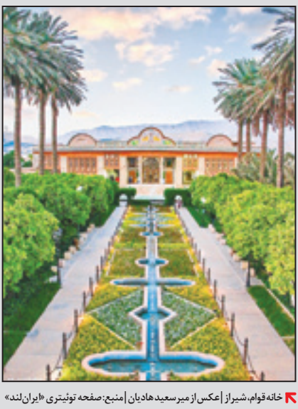
خانه‌نوام، شیراز