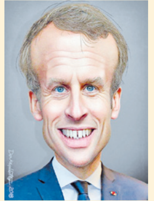
■ Donkey Hotey