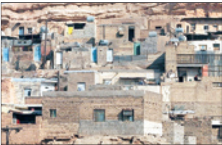
حور به ملکی