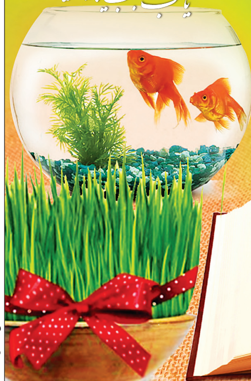
طرح: حسین کشمکش