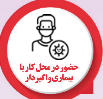
حضور در محل کار با بیماری و اگیردار