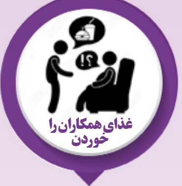
غذای همکاران را خوردن