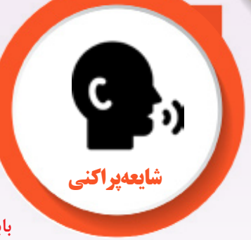
صحبت در مورد سیاست

شکایت بیش از حد اگر گاهی ناراضی خود را از نحوه رسیدگی به مشکلات یا رسیدگی به برخی امور ابراز کنید، مشکلی ایجاد نخواهد شد، اما اگر ابراز ناراضی به یک عادت تبدیل شود، در این صورت بهتر است این عادت را اصلاح کنید، زیرا ممکن است برای شما مشکلاتی ایجاد کند که هرگز تصورش را هم نمی‌کردید. اول اینکه هیچ کس یک معترض همیشه‌گی را دوست ندارد. اگر در کنار آمدن با حجم کاری زیاد یا برخورد با یک همکار در درس‌ساز مشکل دارید، آن را با یک دوست یا در مانگر در میان بگذارید و حین کار خونسرد باشید.