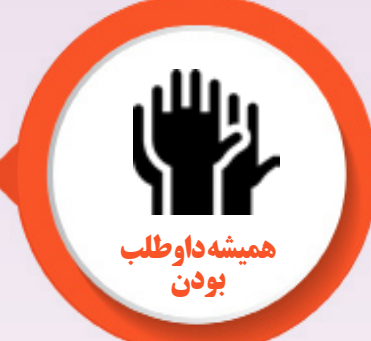
همیشه داوطلب بودن