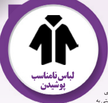
لباس نامناسب پوشیدن