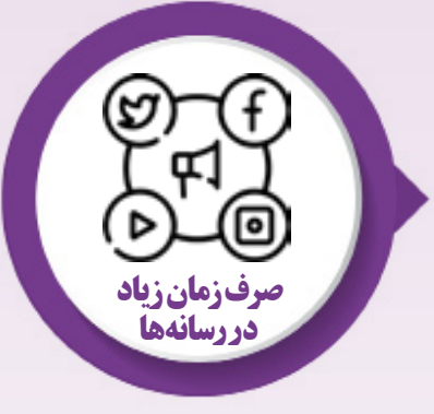
صرف زمان زیاد در رسانه‌ها