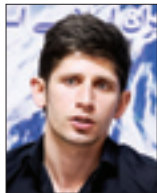
محمدباقری‌معتمد نایب‌قهرمان سابق المپیک

اما وقتی بازیکن بدون انتخابی فیکس می‌شود و هیچ‌کس نمی‌داند در انتخابی‌ها چه گذشته، نتیجه همین می‌شود.