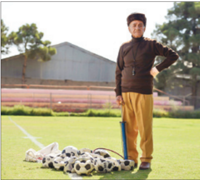
▲ فیلم اکران نوروزی «پرویز خان»

دیگری را از نقش این شهید و هم‌زمانش در شروع جنگ ارائه دهد.