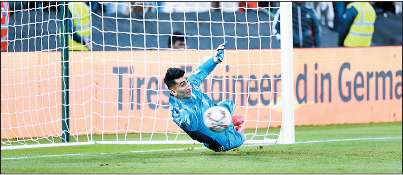
قطار ایست مساحان

ستاره‌های تیم ملی فوتبال مقابل عمان در گفت‌وگو با خبرنگار اعزامی «جوان» به امارات: