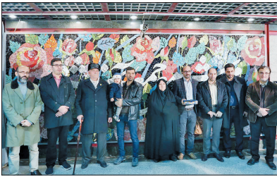
ساره بیات در مراسم سفیر صنایع دستی ایران

پوشیدن پالتوی پوست روپاه برای ساره بیات که در کنار بازیگری،سفیر صنایع دستی ایران نیز هست حاشیه‌ساز شد. انتشار عکسی که ساره بیات در آن تبلیغ پالتویی با پوست روباه کرده منجر به اعتراضاتی از وی شد. این عکس که چند روزی است دست به دست می‌شود و واکنش‌های منفی عیند ساره بیات به همراه داشته هنوز هم تکذیب نشده است، یعنی احتمالاً درست است و حالا ساره بیات بازیگر سینما باید توضیح بدهد که این عکس درست است و شاید هم عذرخواهی بابت تبلیغ کالایی که برای درست کردن آن حیوانی را کشت و پوست آن را کند. ماجرا وقتی داغ‌تر شد که برخی این موضوع را به سفیر صنایع دستی بودن ساره بیات پیوند زدند. خیلی‌ها نمی‌دانستند او سفیر صنایع دستی است. بعضی‌ها هم می‌دانستند، بنابراین حالا حداقل خسن این خبر آن است که خیلی‌ها فهمیدند خانم بیات سلبریتی سینمای ایران سفیر صنایع دستی هم هست. یک زمانی شاید پوشیدن لباس‌هایی با پوست حیوانات ارزش بود اما امروز با تغییر نگاه به محیط زیست، به یک ضد ارزش تبدیل شده است، بنابراین اگر پالتوی پوست روباه روی تن ساره بیات واقعی است یا مصنوعی، با توجه به جایگاه و تأثیرگذاری‌اش، اشتباهی بزرگی است برای افراد سرشناس یا به اصطلاح سلبریتی و حتماً پیام تلخی دارد.