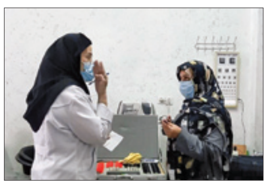
خدمات‌رسانی جهادگران در ایام نوروز